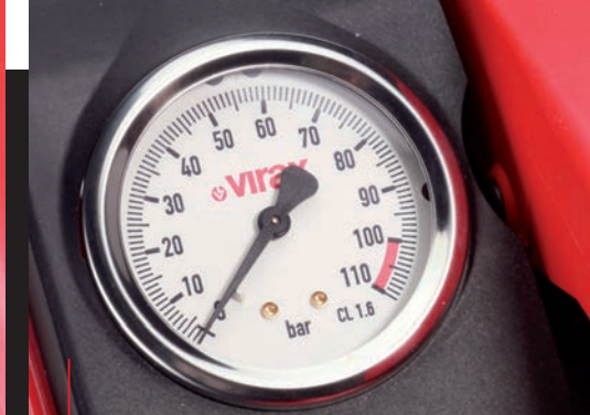
Манометр на 100 бар