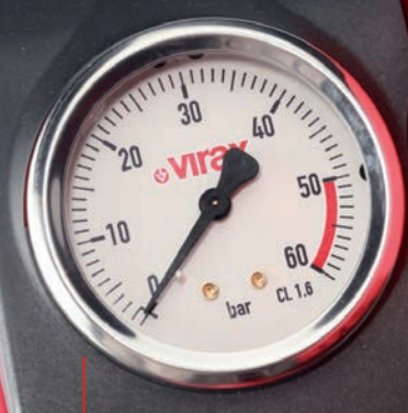
Манометр на 50 бар